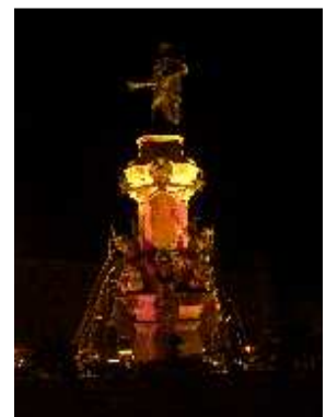
Von PAX2005 zu MAX06 weitergeführte Ansichten