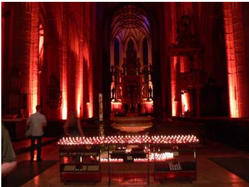
Ulrichsbasilika Innenraum in täglich wechselnden, angepassten Stimmungen