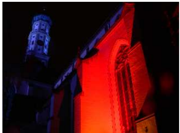
Ulrichsbasilika in Blau, Fassade Basilikaeingang in stündlich wechselnden, angepassten Farben