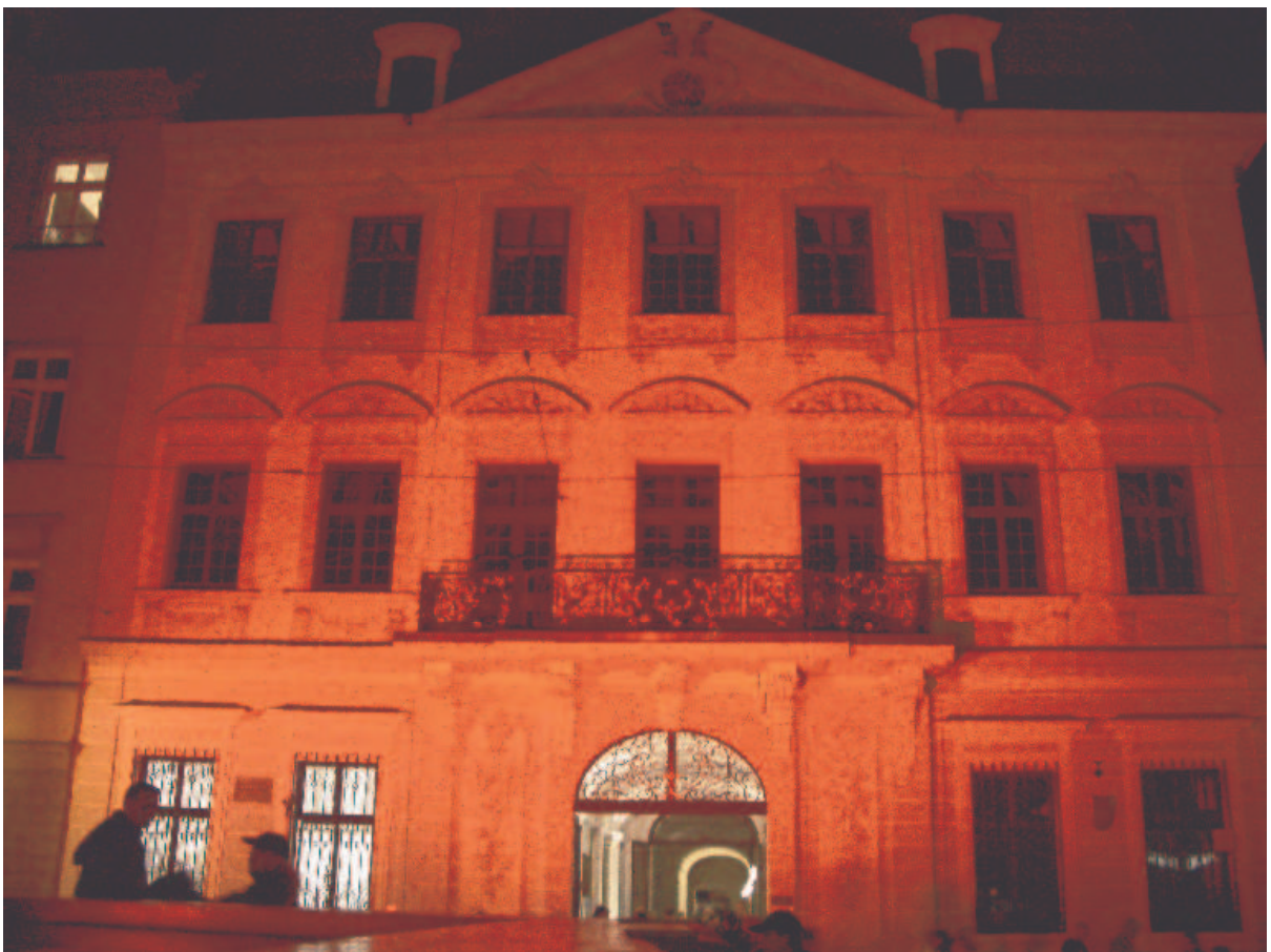
Das Schaezlerpalais in der Mitte der Festzone wurde in zeitlicher Dramaturgie farbig hell erleuchtet, als einzige Fassade der Maxstraße in den Mittelpunkt gesetzt.