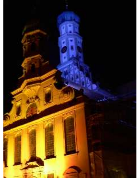
Ulrichsbasilika in Blau, Ulrichskirche in stündlich wechselnden, angepassten Farben